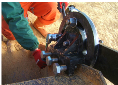
写真 - 3

本体は3つの部品で構成されていて、取り付けは短時間に行うことが出来ます。取付方法も角度調整後ボルトの締付けのみで、簡単に取り付けや取り外しが出来ます。(写真-3)